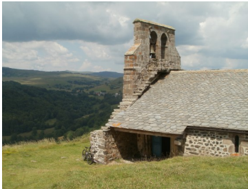
Chapelle Saint-Antoine - Neck de Chastel

Cette étape revêt plusieurs richesses patrimoniales parmi lesquelles l'église romane de Moissac et sa pierre tombale du pèlerin, la croix de Mons, le charmant village de Chalinargues, le bois de Chavagnac et la tourbière de Brujaleine classée Espace Naturel Sensible. Il ne faudra pas non plus manquer le rocher de Chastel surmonté d'une magnifique chapelle romane qui offre un superbe panorama sur les monts du Cantal qui se font tout proches, ou encore le rocher de Bonnevie en haut duquel on pourra profiter d'une vue imprenable sur Murat qui bénéficie du classement Petite Cité de Caractère.