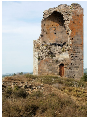
Tour de Mardogne (privé)