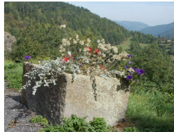
Vallée de l'Alagnon depuis Joursac

6- Prendre à gauche et poursuivre en longeant en partie une ancienne voie ferrée puis regagner le centre de Neussargues en Pinatelle par la route (attention à la traversée de la RN122).